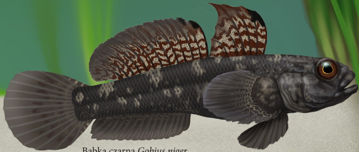
Babka czarna Gobius niger